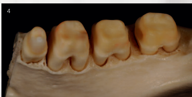
Abb. 4 Zahntechnische Grenzerfahrung Präparation: zwischen substanzschonend und ausreichend Platz – gar nicht so einfach