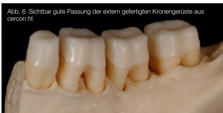
Abb. 6 Sichtbar gute Passung der extern gefertigten Kronengerüste aus cercon ht

Als nächstes reduzierte ich okklusal partiell (Abb. 10), um dort Intensiv-/Sekundärdentin ID 3 einbringen zu können. Nach dem ersten Brand war ich über-