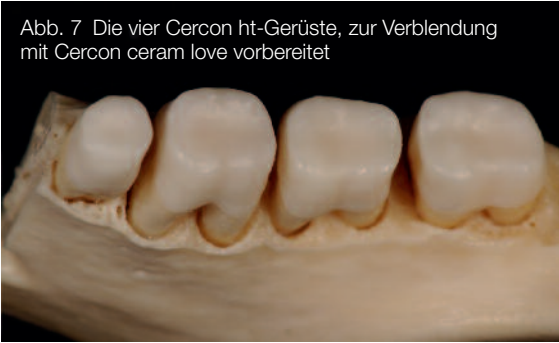
Abb. 7 Die vier Cercon ht-Gerüste, zur Verblendung mit Cercon ceram love vorbereitet