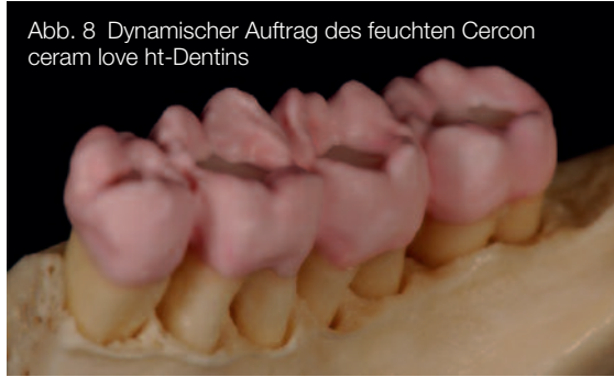
Abb. 8 Dynamischer Auftrag des feuchten Cercon ceram love ht-Dentins