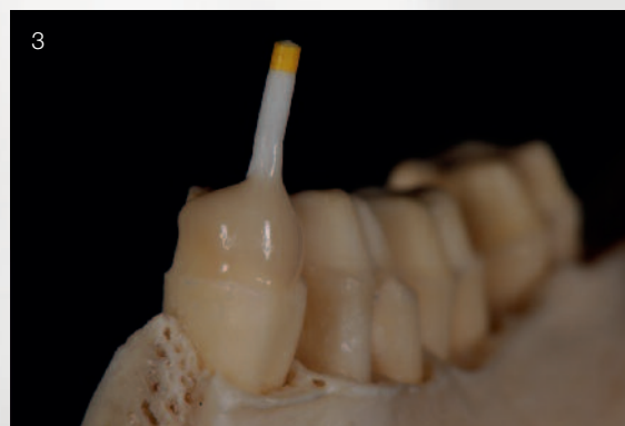
Abb. 3 Zunächst musste Zahn 34 „endodontisch versorgt“ also mit einem Glasfaserstift versehen werden