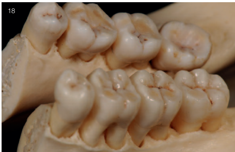
Abb. 18 Im Vergleich zum natürlichen Vorbild (vierter Quadrant) zeigt sich, dass die farbliche Wirkung gut getroffen wurde