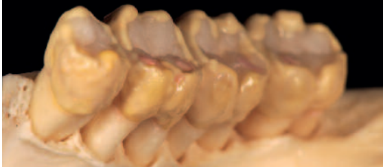
Abb. 12 Um die Zähne stärker zu vergrauen, ergänzte ich die Zahnform mit Transpa Clear (das zur besseren Visualisierung gelb eingefärbt wurde)