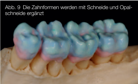
Abb. 9 Die Zahnformen werden mit Schneide und Opalschneide ergänzt