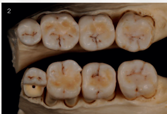
Abb. 2 Der schlechter erhaltene dritte Quadrant soll präpariert und mit Zirkonoxid-basierten Vollkeramikronen „neu versorgt“ werden