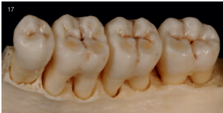
Abb. 17 Der fertig gestellte Seitenzahnbereich des dritten Quadranten im Detail