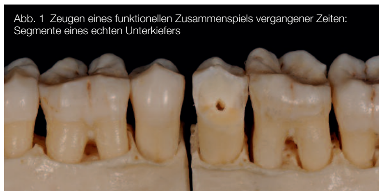
Abb. 1 Zeugen eines funktionellen Zusammenspiels vergangener Zeiten: Segmente eines echten Unterkiefers

Nach Abschluss der Präparation (Abb. 4) scannte ich das Objekt und nahm eine virtuelle Gerüstmodellation vor (Abb. 5).