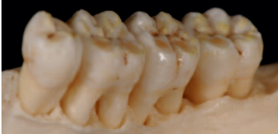
Abb. 15 Beim Glanz-/Korrekturbrand werden lediglich noch ein paar Leisten herausgearbeitet